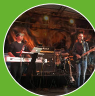
Bye Bye Goliath

Ehemals als „D-Projekt“ bekannt ist „Bye bye Goliath“ als Lobpreisband unterwegs und hält Seminare